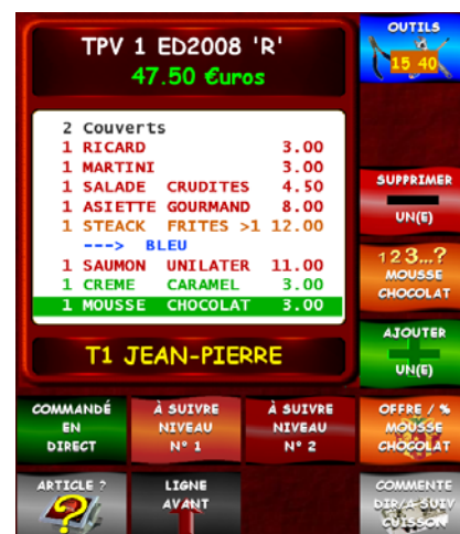
Ticket Vente Écran